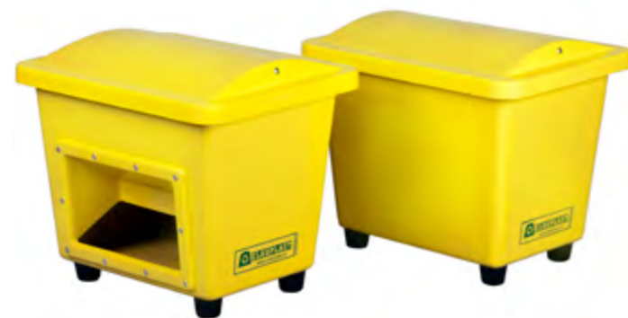
SBA 110 avec/sans ouverture de vidange