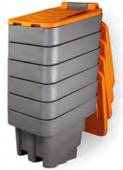
BACS À SEL EMPILÉS