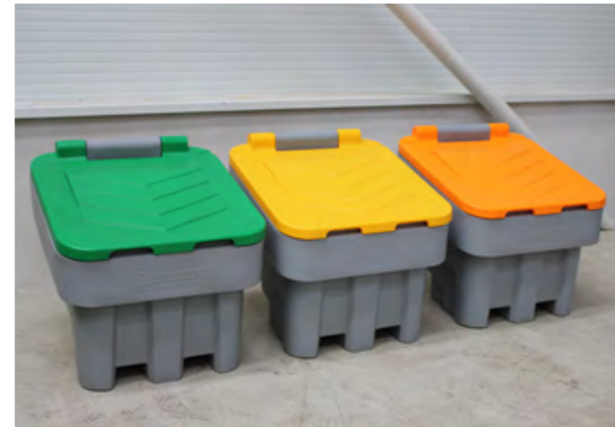
ARROW 400 différentes couleurs de couvercle