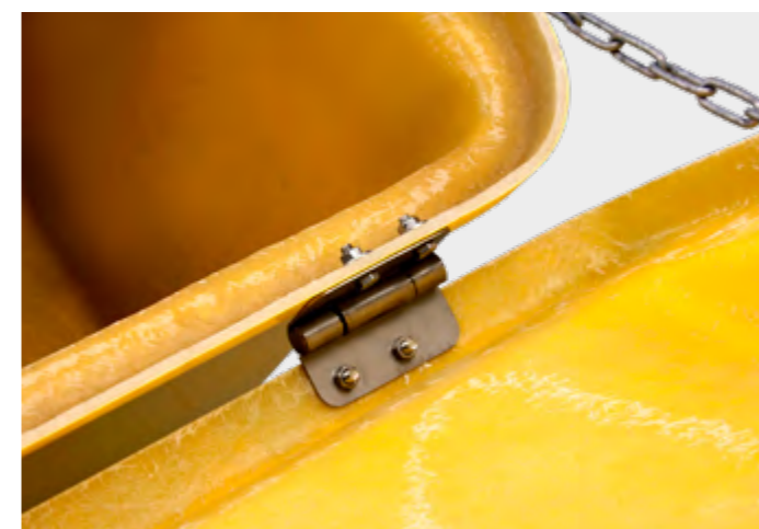
détail de charnière en acier inoxydable